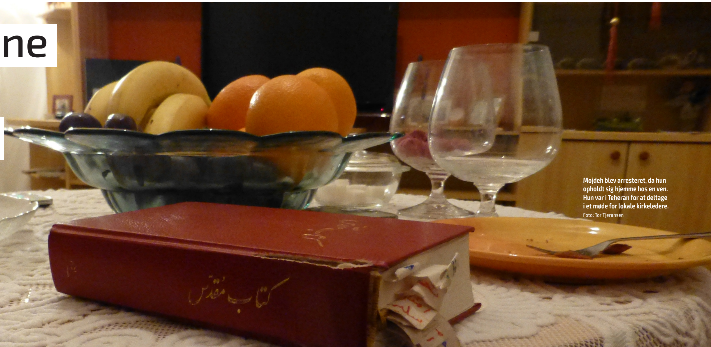
Mojdeh blev arresteret, da hun opholdt sig hjemme hos en ven. Hun var i Teheran for at deltage i et møde for lokale kirkeledere.

Af SAT-7 / oversat og bearbejdet af Thomas Godsk Larsen