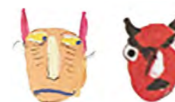
Illustration fra Synne Garffs De Mindstes Bibel : Hvordan tror du, kainsmærket ser ud? Illustration af Cato Thau-Jensen og Lillian Brøgger.

De tre sidste er udgivet på Bibelselskabets Forlag og kan købes i Bibelselskabets webbutik.