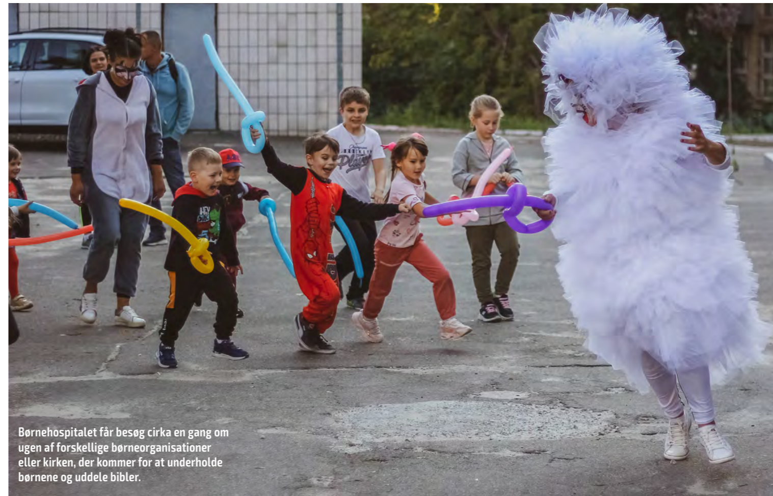
Børnehospitalet får besøg cirka en gang om ugen af forskellige børneorganisationer eller kirken, der kommer for at underholde børnene og uddele bibler.