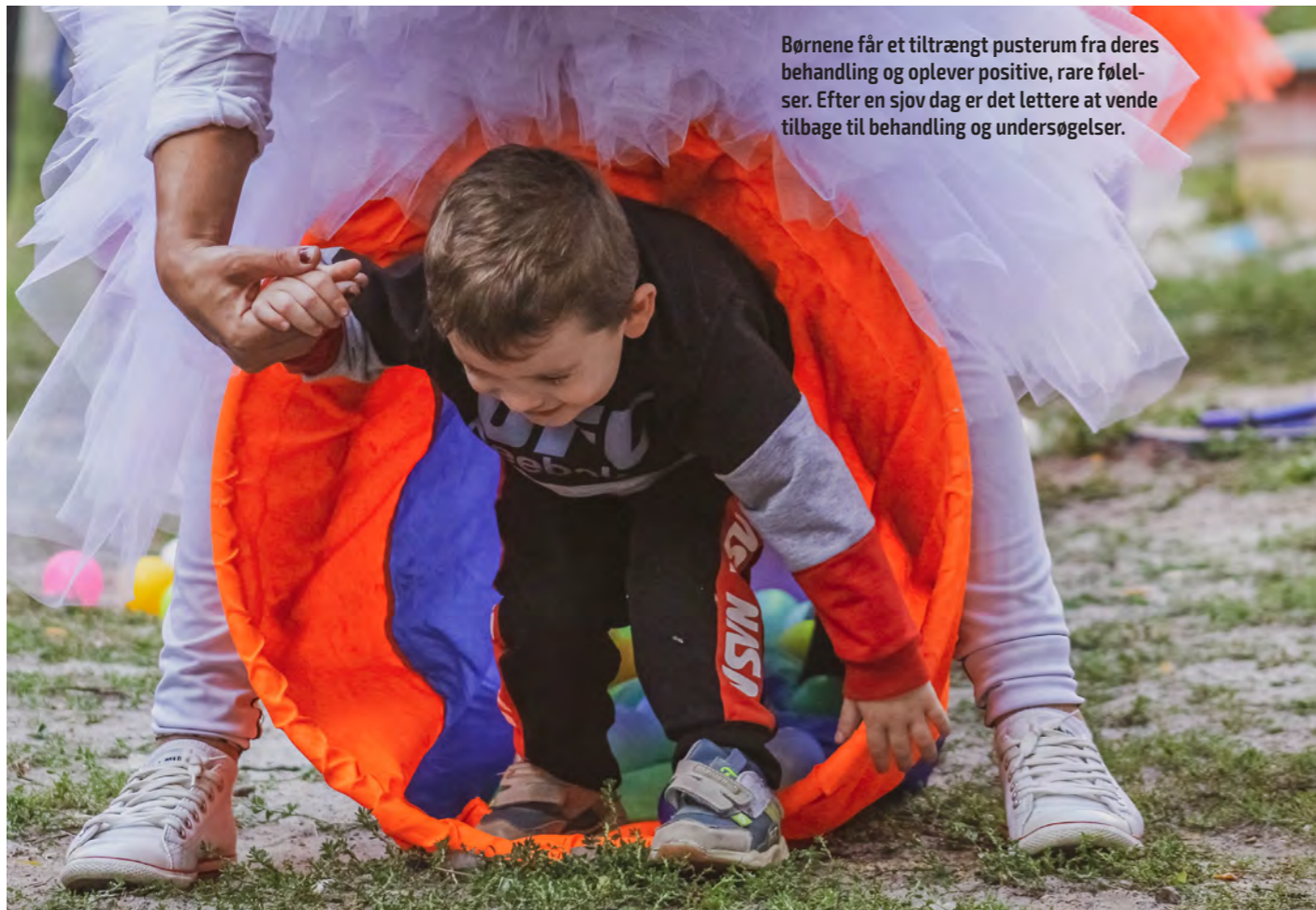
Børnene får et tiltrængt pusterum fra deres behandling og oplever positive, rare følelser. Efter en sjov dag er det lettere at vende tilbage til behandling og undersøgelser.