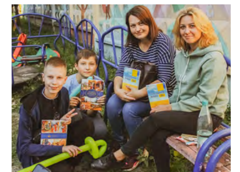
Også forældrene sætter stor pris på bibeluddelingen. Mange af forældrene kommer i den lokale kirke, mens deres børn er indlagt.

En onsdag eftermiddag i Kievs lune septembervejr besøgte jeg sammen med Det Ukrainske Bibelselskab et børnehospital. Det største i Kiev og det eneste sted i Ukraine, der tager imod børn, der ikke kan få hjælp andre steder.