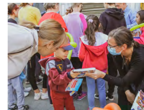
Børnene er altid interesserede i Bibelen og glade for at få deres helt egen udgave.