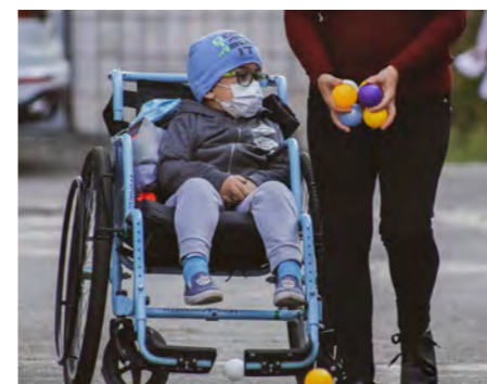
Børnene er indlagt på hospitalet fra 2 uger til 2 måneder afhængig af, hvor alvorlig deres sygdom er. Ofte er forældrene indlagt med børnene.