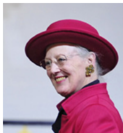
Bibelselskabets protektor er Hendes Majestæt Dronning Margrethe II.

Bibelselskabet modtager ingen offentlig driftsstøtte og er derfor afhængig af indsamlede midler og salgsindtægter.