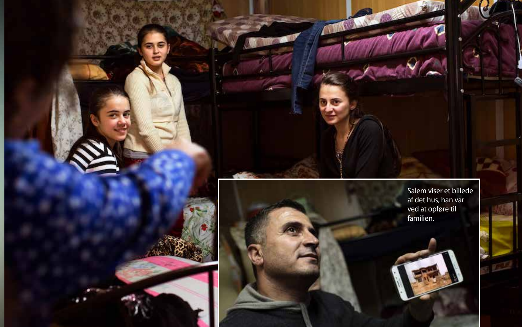
Salem viser et billede af det hus, han var ved at opføre til familien.