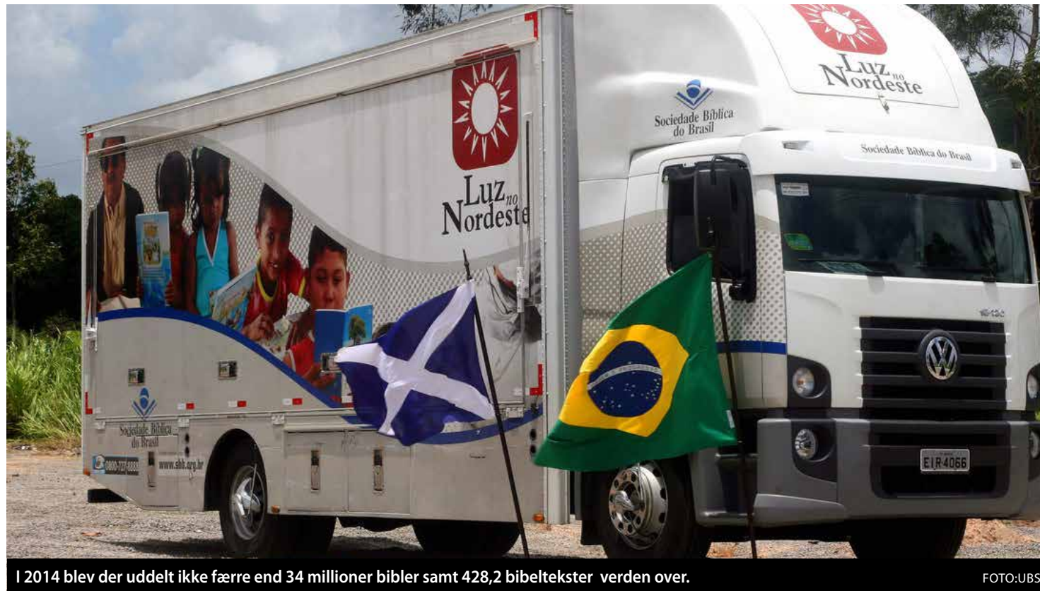
I 2014 blev der uddelt ikke færre end 34 millioner bibler samt 428,2 bibeltekster verden over.

Udover de uddelte bibler har De Forenede Bibelselskaber også haft succes med en stadig større uddeling af bibeltekster på cd, kassetband, dvd og til download fra internettet.