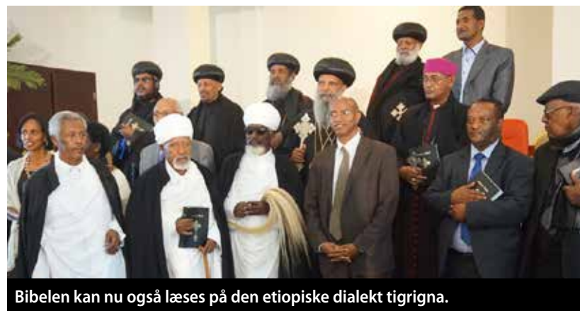
Bibelen kan nu også læses på den etiopiske dialekt tigrigna.