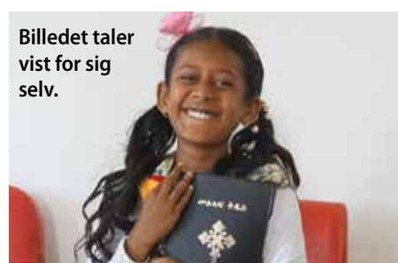
Billedet taler vist for sig selv.