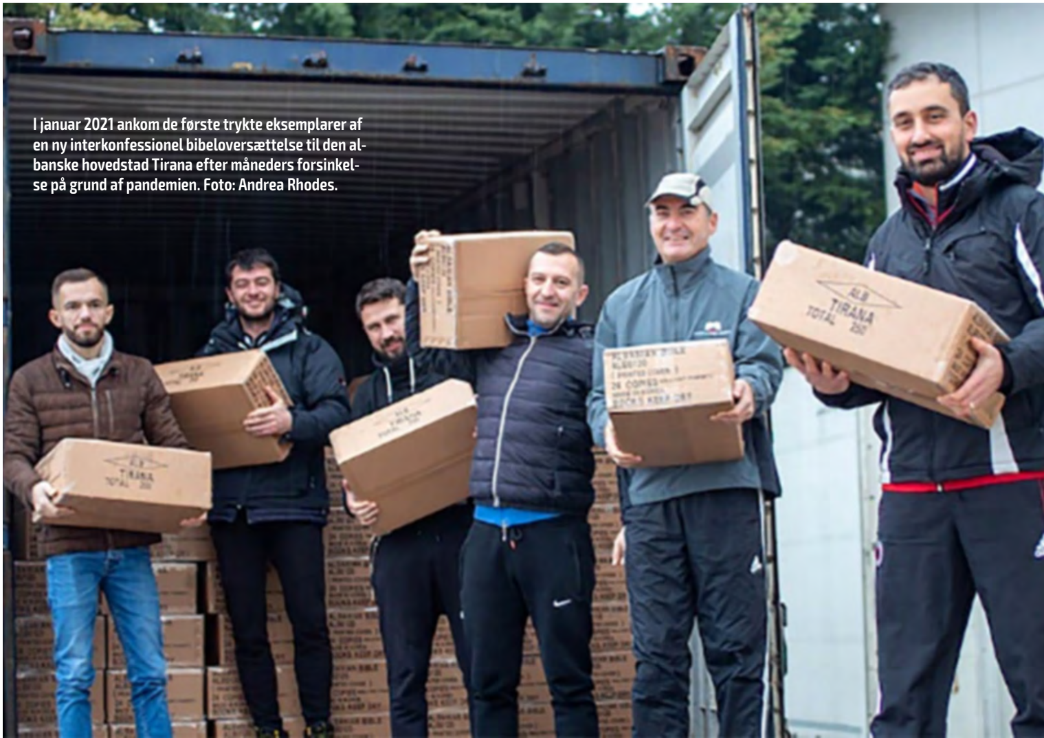
I januar 2021 ankom de første trykte eksemplarer af en ny interkonfessionel bibeloversættelse til den albanske hovedstad Tirana efter måneders forsinkelse på grund af pandemien.